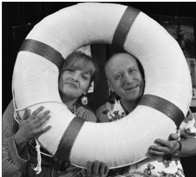
DS Lužnice zahraje detektivní komedii Ani za milion!

Divadelní soubor Kulturního spolku v Česticích